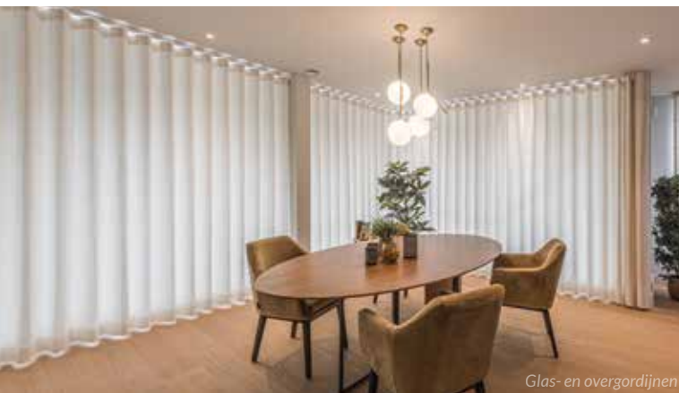
Glas- en overgordijnen